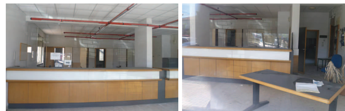
Vista interna della proprietà

Esternamente lo stato manutentivo risulta discreto, all'interno l'unità necessita di una completa ristrutturazione edile ed impiantistica al fine di adeguarla ai moderni standard funzionali.