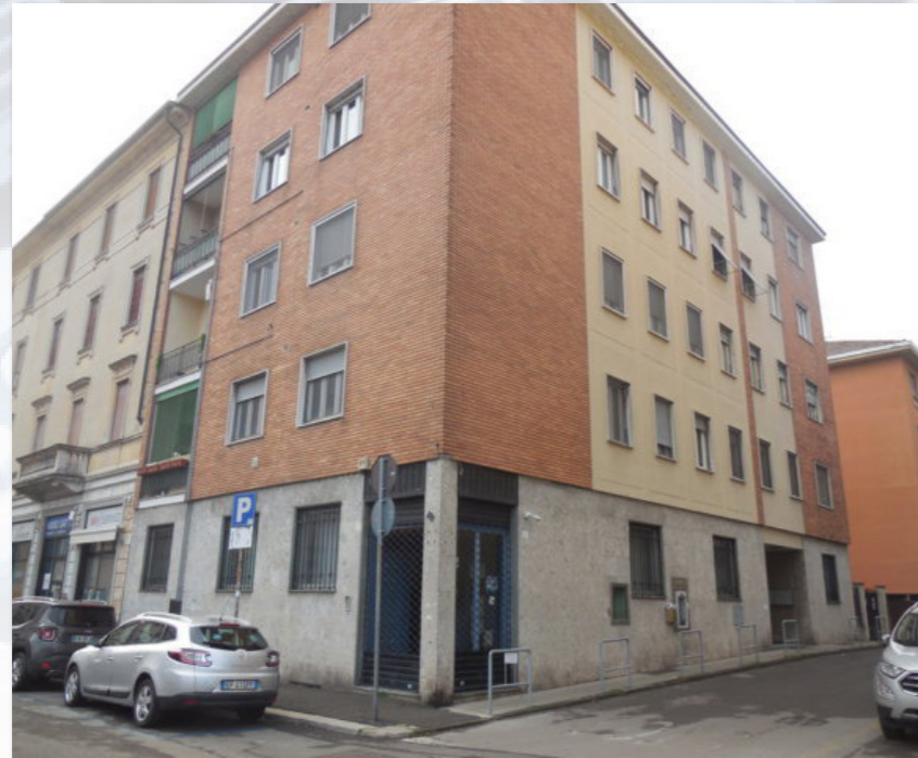
PAVIA (PV) via dei Mille, 7