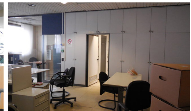
Vista interna unità direzionale