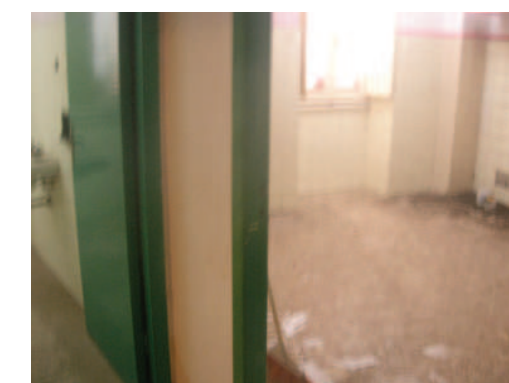
Vista interna della proprietà