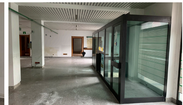
Vista interna unità commerciale/direzionale