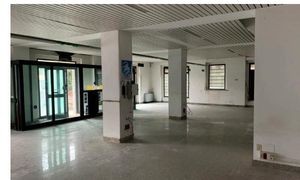
Vista interna unità commerciale/direzionale

Lo stato di manutenzione e conservazione è discreto.