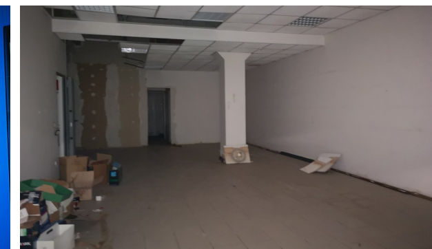
Vista interna unità commerciale