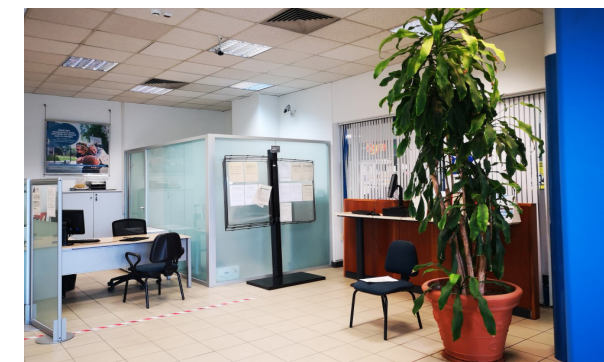
Vista interna unità commerciale

Lo stato di manutenzione e conservazione si può ritenere buono.