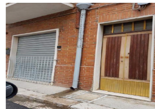
Vista Esterna Fabbricato

Il bene in esame è situato all'interno di un complesso immobiliare su due livelli fuori terra ed uno interrato, destinate ad assolvere funzioni di tipo residenziale con le relative pertinenze realizzato presumibilmente in epoca antecedente al 1967. Nell'intera palazzina vi sono due appartamenti; al piano interrato invece vi è il locale deposito oggetto di analisi. Il fabbricato si colloca nella porzione nord rispetto al centro del comune di San Severo. Tale fabbricato, privo di recinzioni si affaccia direttamente sulla pubblica Via Leoncavallo. Il complesso, dotato di discreta visibilità, si connota su via Leoncavallo ed è allineato a complessi di tipo residenziale aventi caratteristiche tipologiche simili all'immobile in oggetto. Il fabbricato si sviluppa su due piani fuori terra ed uno interrato, con tipologia costruttiva mista in muratura e calcestruzzo gettato in opera ed ha un livello di finiture ordinarie. Le destinazioni dei singoli immobili risultano omogenee e si presentano con similari condizioni d'uso e manutenzione. Da quanto visibile esternamente si presume uno stato di manutenzione discreto del bene.