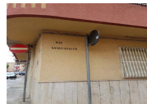
Vista nominativo strada di ubicazione