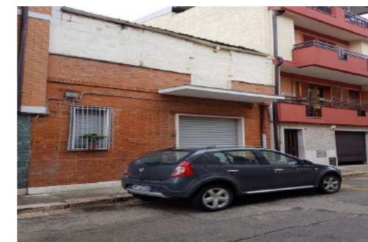
Vista Esterna Fabbricato