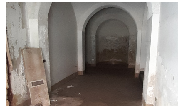
Vista interna unità commerciale

La Proprietà necessita di ristrutturazione.