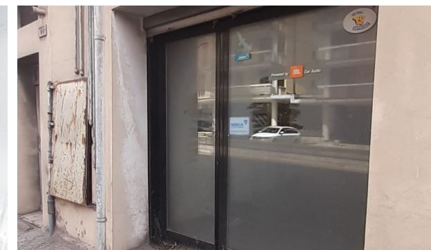
Vista esterna unità commerciale