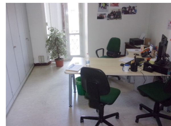
Interno Piano Terra