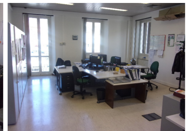
Interni Piano Primo