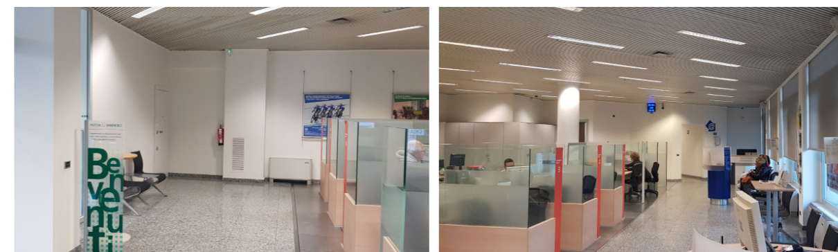
Vista interna unità direzionale

Lo stato di manutenzione e conservazione è discreto.