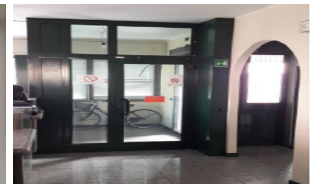
Vista interna unità commerciale