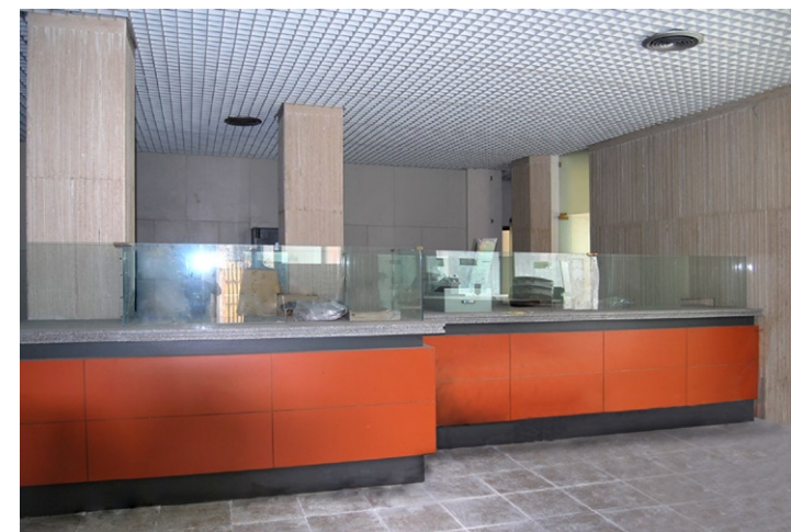
Vista interna della proprietà

Presenti le usuali dotazioni d'impianto.