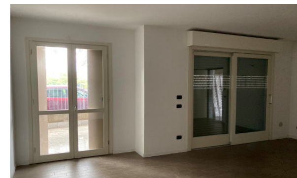
Vista interna unità residenziale

Lo stato di manutenzione e conservazione si può ritenere buono.